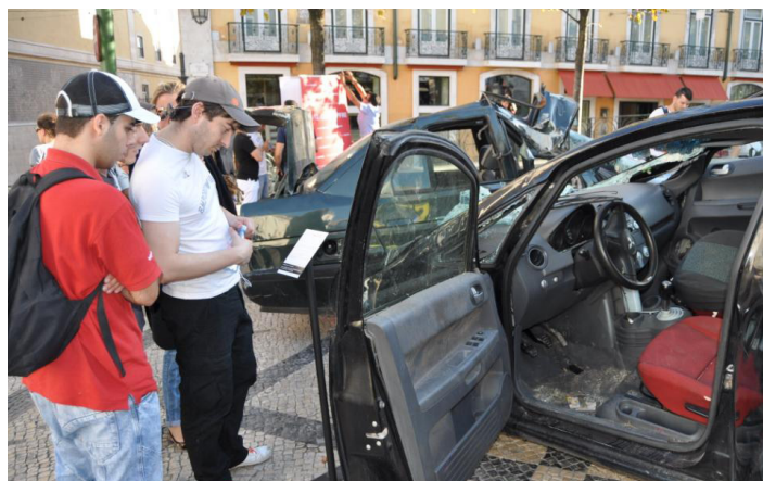
Iniciativa "Ao Fim de Semana Tu Decides", realizou-se este ano em Lisboa.

volvidas enquadram-se sobretudo em dois dos cinco institutos que integram a Fundação, nomeadamente o da Segurança Rodoviária e o da Saúde e Meio Ambiente, embora, no futuro, não estejam descartadas hipóteses de abraçar projectos nos campos da Cultura e da Acção Social, revelou João Gama ao Impulso Positivo. "Neste momento, estamos a trabalhar basicamente com esses dois institutos. Contudo, no futuro não descartamos, e até temos muito interesse, em desenvolver a questão cultural, além da área de acção social, para a qual estamos há cerca de um ano à procura de um parceiro em Portugal". ●